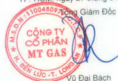
Vũ Đại Bách